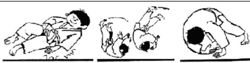
Mae Ukemi migi