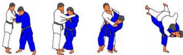
Hane Goshi (genou en barrage, dos du pied sur la cuisse)