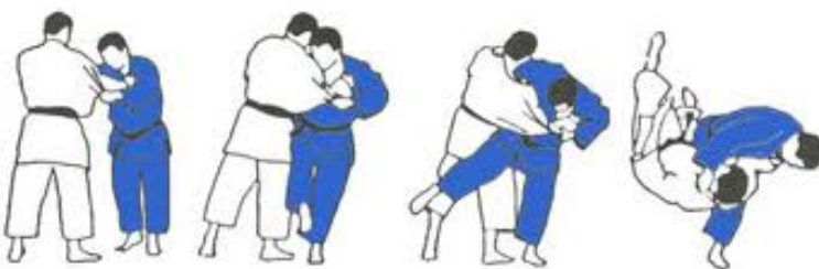
O Soto guruma