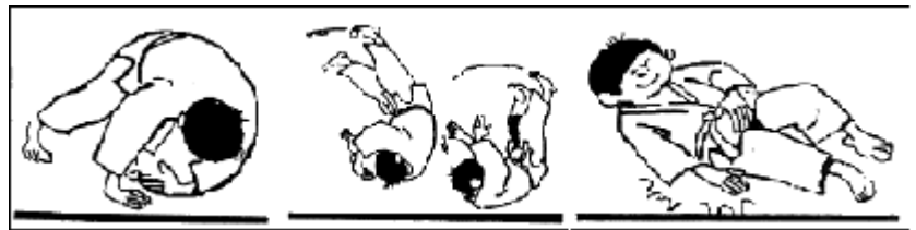
Mae Ukemi hidari