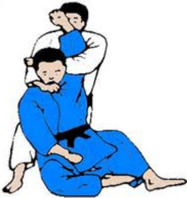
Kata Ha Jime